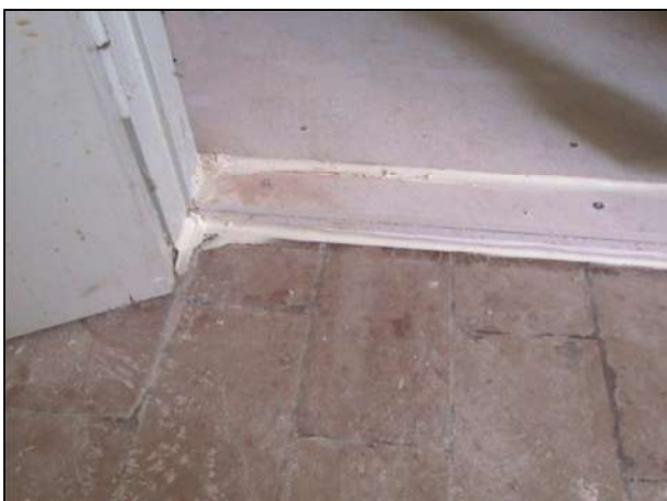
Fotografia del rivestimento in corrispondenza della porta di accesso