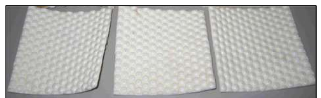
Fotografia di alcuni provini del materassino resiliente "FONOSPHERA PV50"