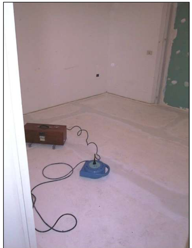
Fotografie della pavimentazione prima e dopo l'installazione del rivestimento